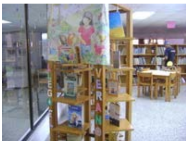
Llegó el verano