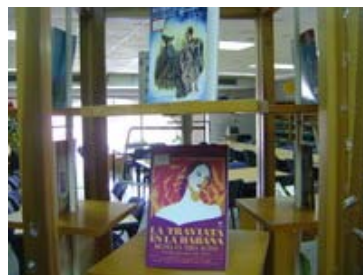
Llegó el verano