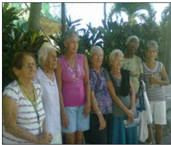
«Círculo de Abuelos» Desarrollar el gusto por la poesía, es también nuestra máxima.

Arribamos al mes del amor, con una selección acorde al momento - la poesía- ¿qué decir de lo sucedido?, llegó como regalo para este público, el libro: "Por una mirada un mundo" , de Gustavo Adolfo Bécquer, poeta y narrador español.